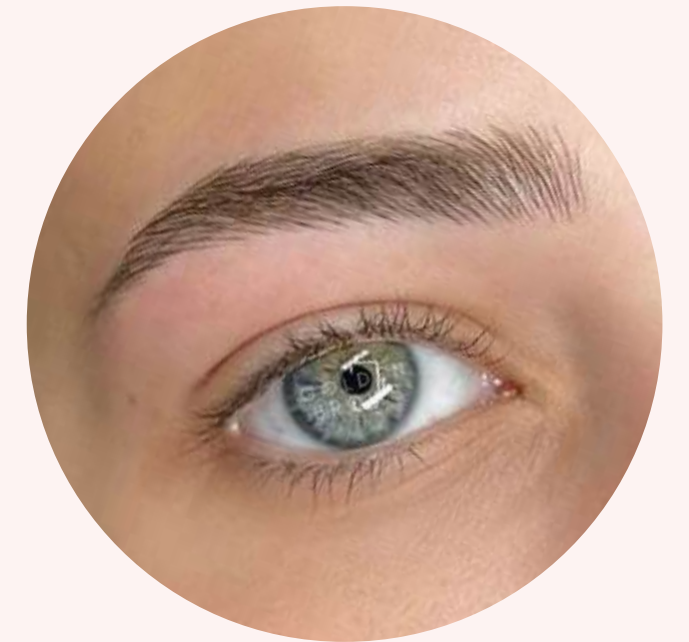
Cejas Hybrid Brows